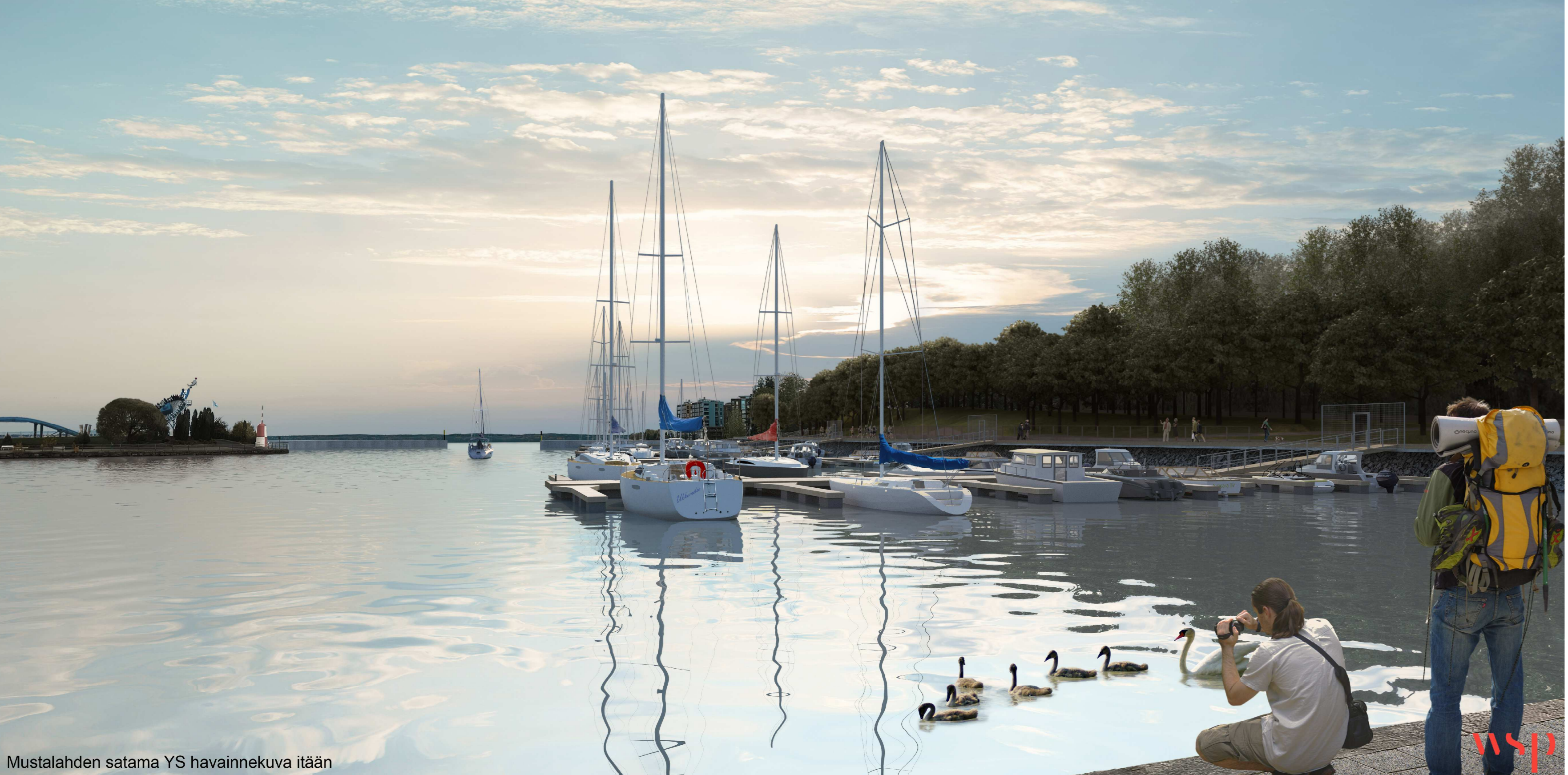
Mustalahden satama YS havainnekuva itään